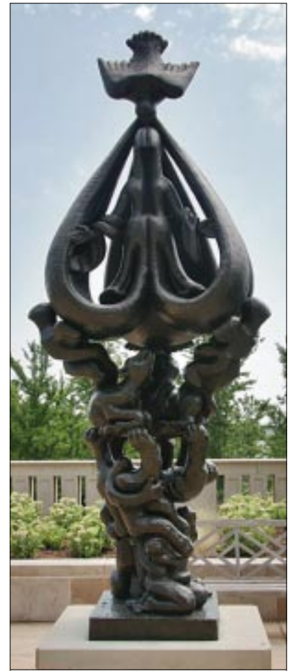
“Virgen” de Jacques Lipchitz

¿Quién podría decir lo mismo del otro cuadro, que representa a Nuestra Señora de los Dolores, de Simón Marmion, pintor del siglo XV?