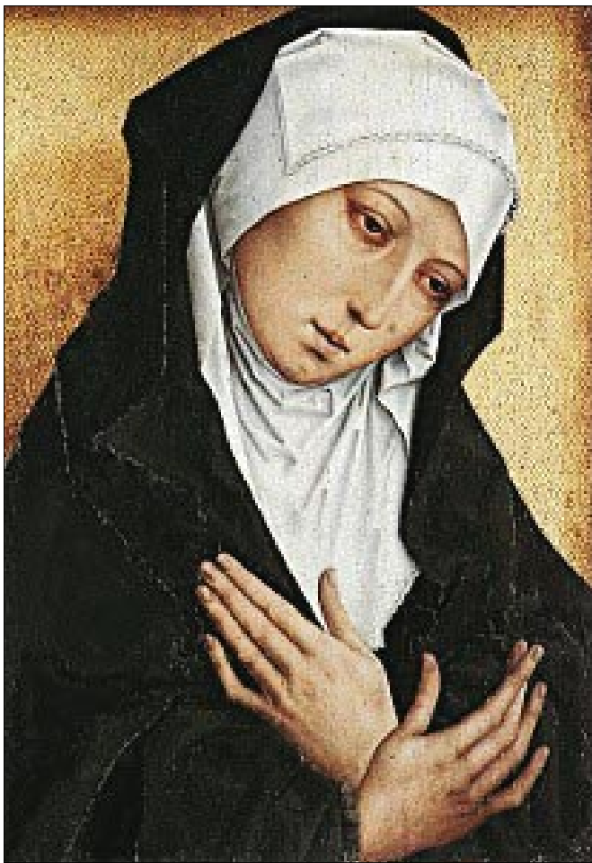
Nuestra Señora de los Dolores, de Simón Marmion

La extravagancia de la idea y de los pormenores, es chocante. El bulto de la imagen, su gesto, nada deja aparecer de la pureza y la inigualable dignidad de la Madre de Dios. La imagen no instruye, no forma, no atrae. La nota