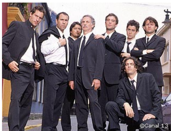
La teleserie “ Machos ” del Canal “católico” preparó el terreno para la aceptación de las conductas homosexuales.

A esta altura, las circunstancias parecieron maduras para que el Presidente Lagos presentara un nuevo proyecto de ley destinado a penalizar a quienes se manifies-