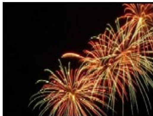
Entre los numerosos trucos, fuegos artificiales de computador

Poco después se denunció que el espectáculo inaugural difundido por