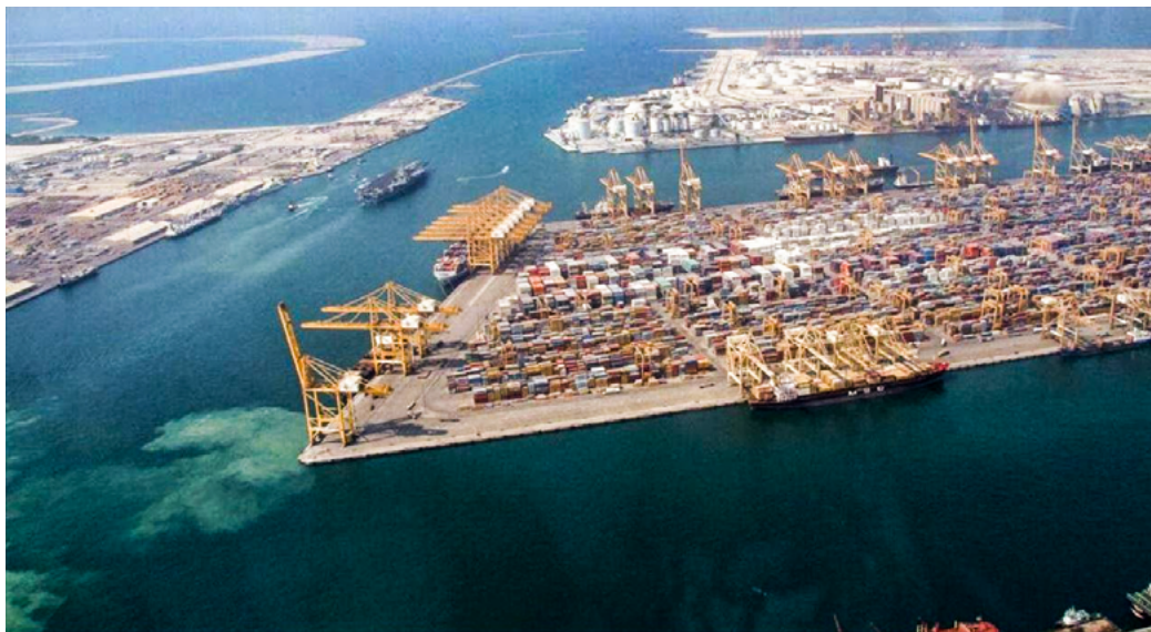
El puerto de Mariel (Cuba) recibió más de 600 millones de dólares del Banco Nacional de Desarrollo de Brasil

dando importancia a este principio. La familia es la célula mater, ya que es el núcleo que contiene en sí, en potencia, todas las demás instituciones y las relaciones humanas. La familia es una pequeña sociedad formada naturalmente. Su existencia es anterior al estado, y un gobierno que no la respeta, que la vilipendia, que la mutila, se destruye a sí mismo. Es lo que estamos presenciando en Brasil desde hace varias décadas, en un triste proceso rumbo hacia el amor libre más desenfrenado, propugnado con estos o aquellos matices por el comunismo en todo el mundo.