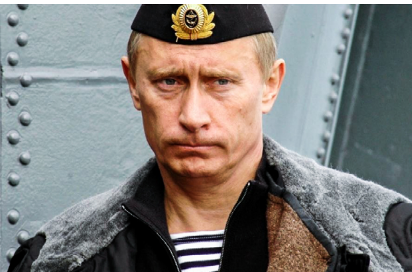
Vladimir Putin, presidente de Rusia

Este es el camino hacia un mal disfrazado miserabilismo, y para un modelo político basado en la autogestión... que era “el objetivo supremo del Estado soviético”, según establecía la propia Constitución de la antigua URSS en su preámbulo. 19 Es el socialismo viejo y gastado, ¡ahora con un nuevo ropaje... verde!