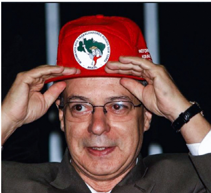
Frei Beto, famoso representante da “esquerda católica”.

la Sociedad Brasileña de Defensa de la Tradición, Familia y Propiedad (TFP) 9 , pacíficamente y dentro de la ley, denunciando al público católico la maniobra solapada,