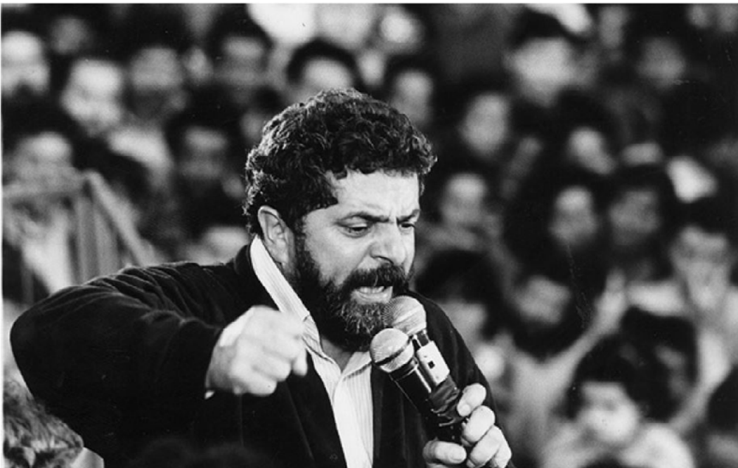
Luiz Inácio Lula da Silva

Sin embargo, no percibiendo que la hora era para la cordialidad y la distensión, interpretaron el momento como una “apertura”, sí, pero para la izquierda; una avenida